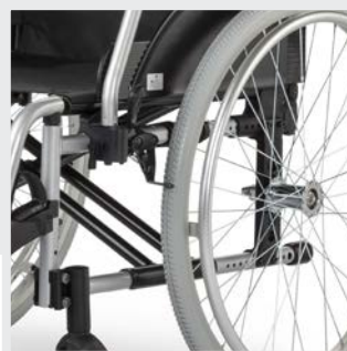
Erhöhte Stabilität durch Verwendung einer Doppelschere