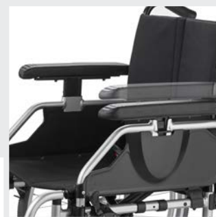
Höhenverstellbares Seitenteil mit tiefeinstellbaren Armauflagen in Serie