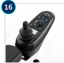
CODE 408 / 682