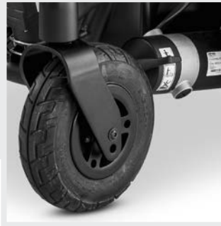
Lenkräder mit Alufelge