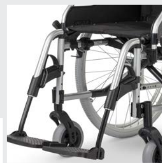
Beinstützen nach innen und außen abschwenkbar