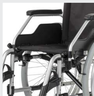
Umrüstung schnell und gezielt möglich