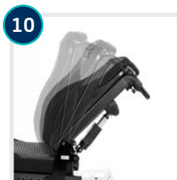
10 CODE 25