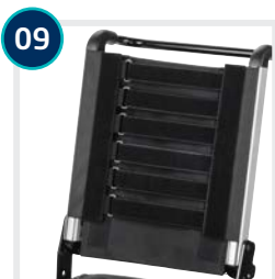
09 CODE 736/287