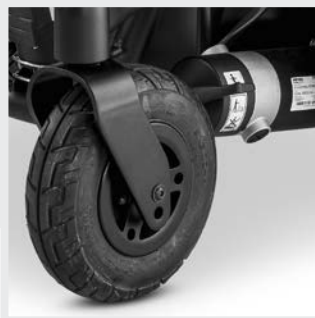
Roues directrices avec jante en aluminium