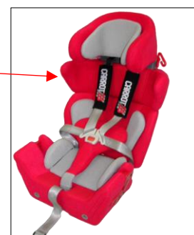
Bis circa 160 cm