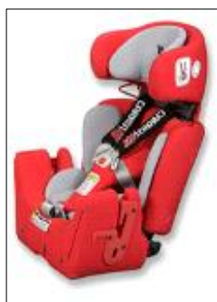
Basisset bis circa 145