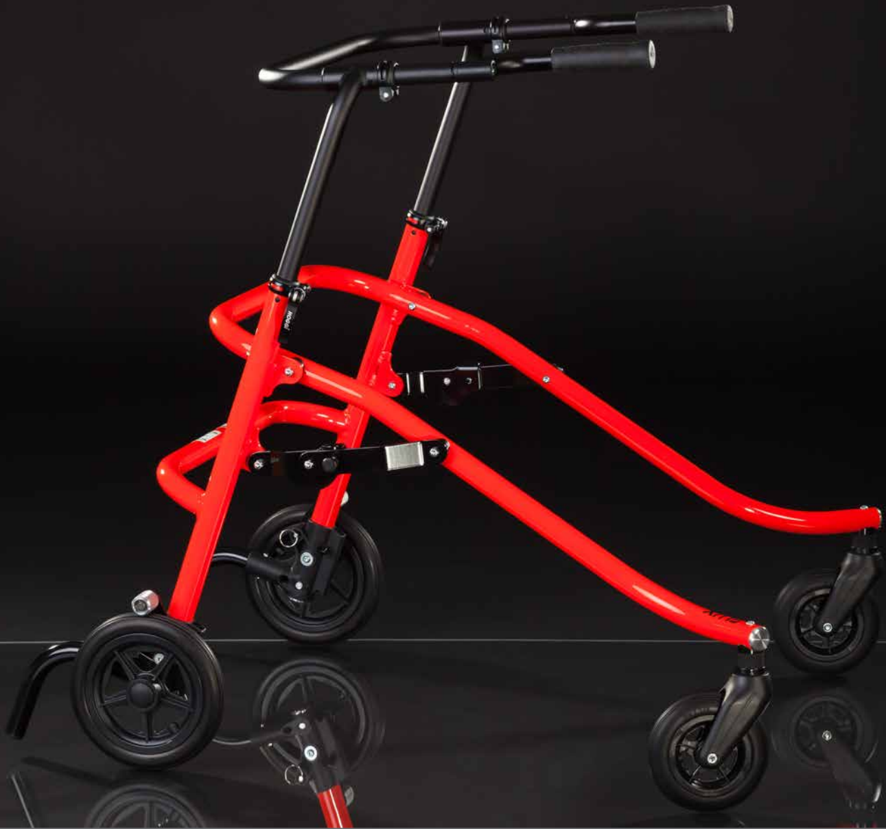
Lauftrainerhilfe FLUX , Größe 3

Die bewährte Lauflernhilfe im neuen Design.