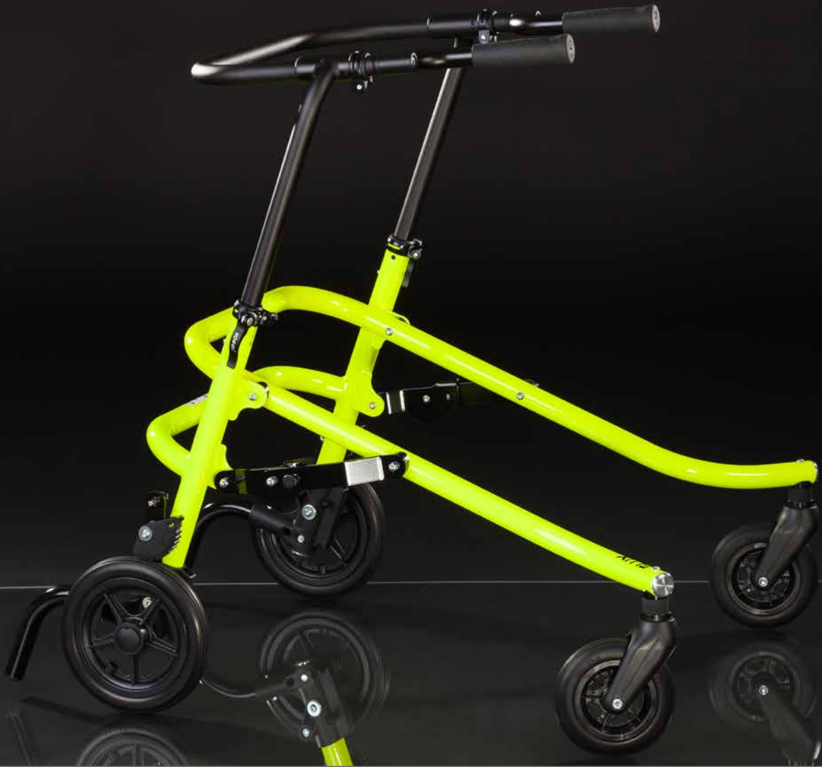
Lauflernhilfe FLUX , Größe 2

Die bewährte Lauflernhilfe im neuen Design.