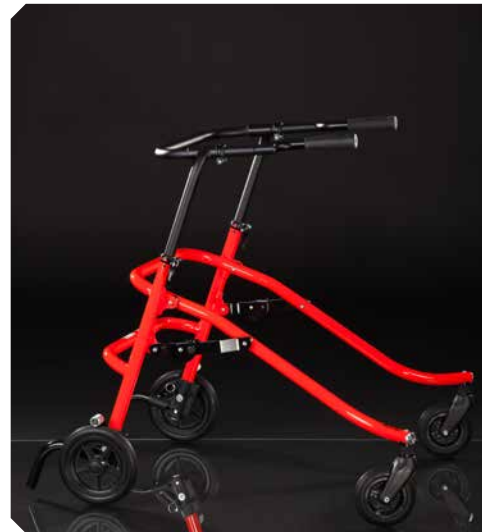
FLUX Größe 3.