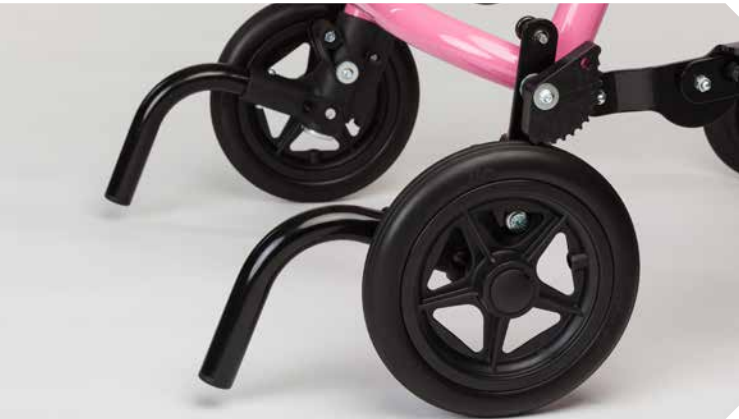
Kippsicherung ohne Rollen.