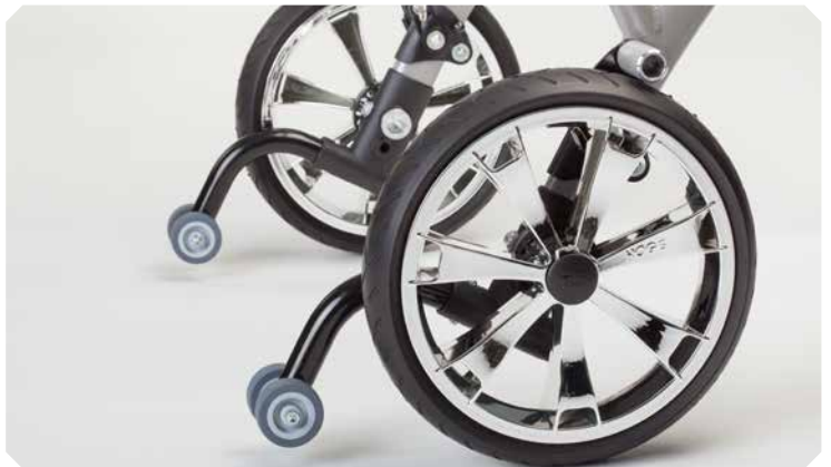
Kippsicherung mit Rollen.