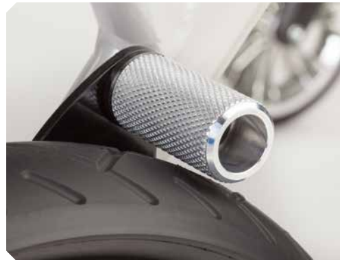
Rücklaufsperrre für Größe 4.