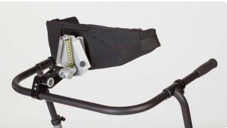
Dynamische Hüftführung mit Hüftgurt.