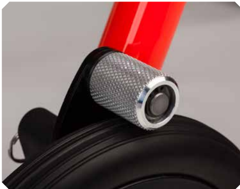
Rücklaufsperrre für Größe 3.