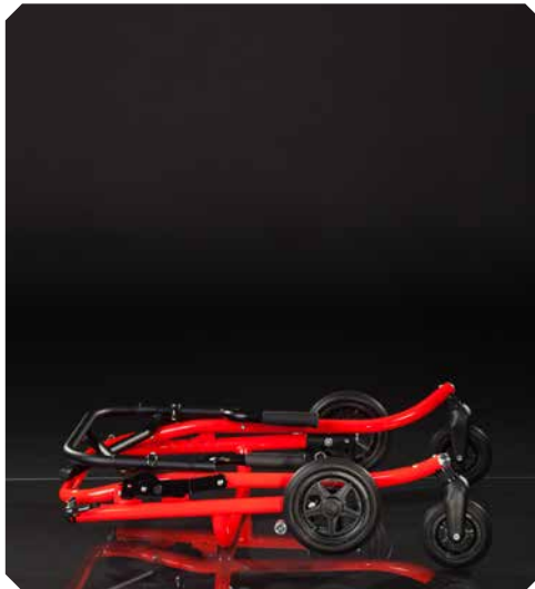
Extrem kompaktes Faltmaß.