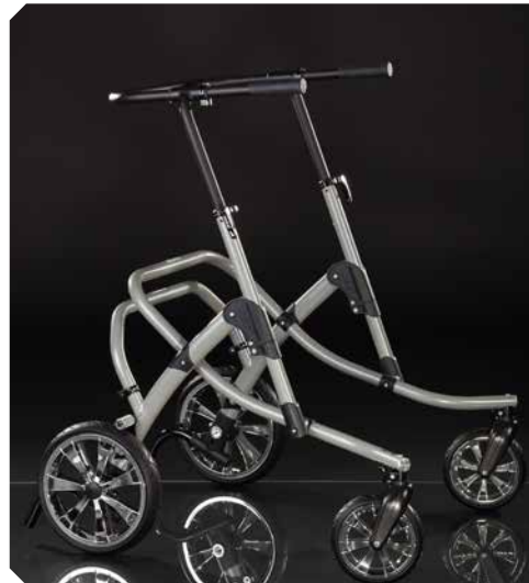
FLUX Größe 4.

Neue Rahmenfarben. Alle Optionen im Internet abrufbar.