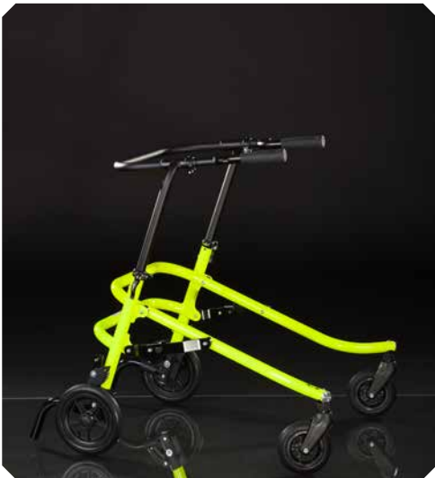
FLUX Größe 2.

FLUX ist die Laufhilfe die dich optimal fördert natürlich zu gehen. In Laufrichtung offen und befreit von physisch störenden Elementen stimuliert FLUX dich zur aufrechten Haltung während des Gehens. Die stabile und dennoch sehr leichte Konstruktion garantiert Sicherheit für deinen Bewegungsablauf.