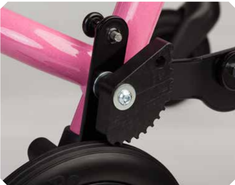
Rücklaufsperrre für Größe 1 + 2.

Stufenlose Höhenverstellung. Sicherheit durch Rücklaufsperrn.